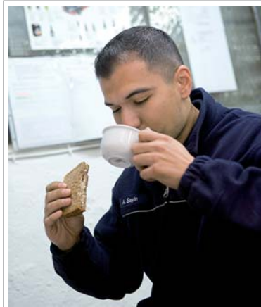
12:12 Uhr: Mittagspause – einmal durchschnaufen und Kraft tanken für die weiteren Aufgaben.