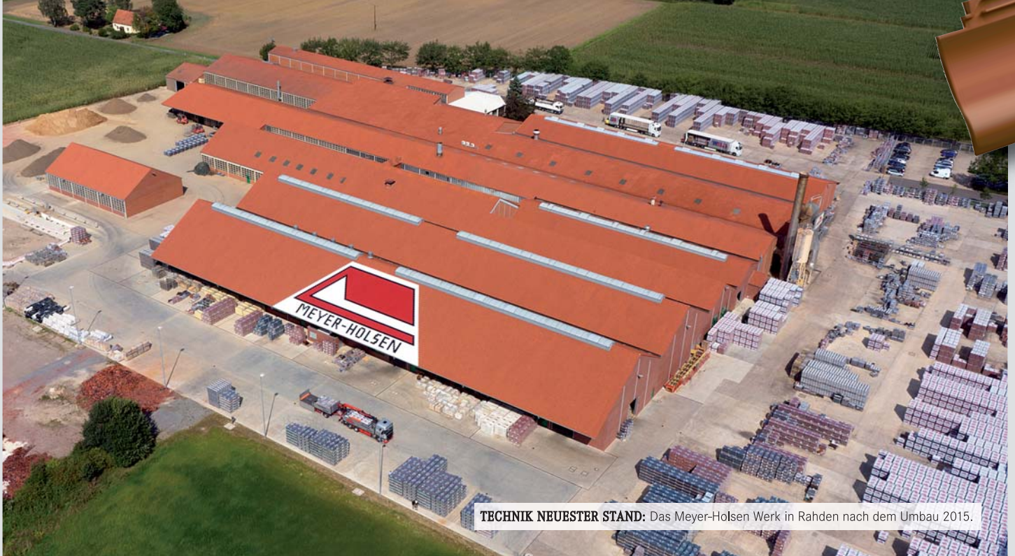
TECHNIK NEUESTER STAND: Das Meyer-Holsen Werk in Rahden nach dem Umbau 2015.