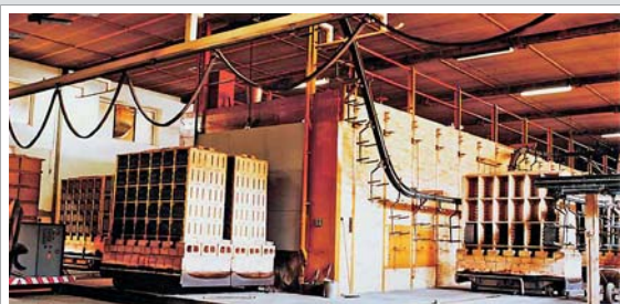
SEINERZEIT EINEN SCHRITT VORAUSS: 1960 nahm Meyer-Holsen den ersten Dachziegel-Tunnelofen in Betrieb - eine wegweisende Neuerung für die gesamte Branche.