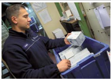
7:32 Uhr: Kontrolle der in der Nacht angelieferten Teile und Verteilung.

+ Teile von der Nachtzustellung sortieren + Bestellte Teile in die Werkstatt geben bzw. in die Kundenfächer legen + Bestellbelege buchen + Rechnungen und Lieferscheine schreiben + Teileausgabe an Werkstatt + Mail-Postfach bearbeiten +