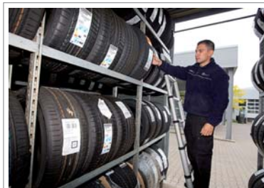
15:34 Uhr: Einen Satz Winterräder aus Reifenlager für Werkstattauftrag kommissionieren.

+ Teile von der Mittagsanlieferung prüfen + Teileausgabe Werkstatt + Bestellbelege buchen + Rechnungen schreiben + Angebote für Verkäufer schreiben +