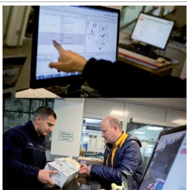
9:59 Uhr: Kundenberatung und Verkauf.

+ Teileausgabe an Werkstatt und Kunden + Telefonverkauf + Großkundenbetreuung + Eingangsrechnungen prüfen + Angebote erstellen + Frühstück + Bestellungen aufgeben + Teile einlagern + Rückstände prüfen + Aufräumen +